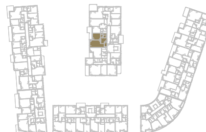
Schéma podlaží _____