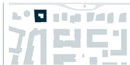
Schéma půdorysu představuje dispoziční řešení bytu. Zobrazené vybavení nábytkem, vestavěné skříně, kuchyňská linka včetně spotřebičů a pračky nejsou součástí dodávky bytu. Toto vybavení je zobrazeno pouze pro názornost. Umístění zařizovacích předmětů je v půdorysu zakresleno schematicky. Specifikace pro konstrukce, povrchové úpravy a vybavení je specifikováno v „Realizačním standardu“. Uvedená užitná plocha bytu se může během realizace stavby změnit. Podlahová plocha bytu je stanovena dle nařízení vlády 366/2013 Sb.